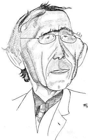
Horst dibujado por Carlos Rodríguez Sutil

https://www.psicoterapiarelacional.es/Documentacion/Autores-Destacados/Horst-Kachele