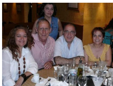
Con parte del grupo de Madrid, 2008