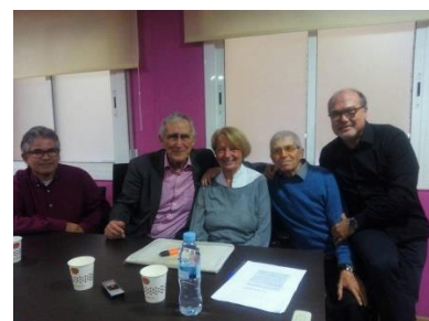
Con el grupo de Barcelona, 2014